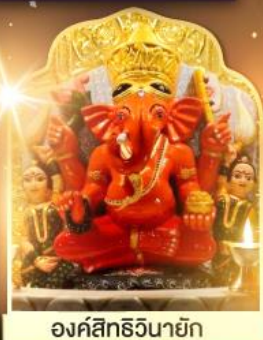
องค์สิทธินายิก