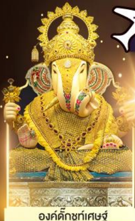
องค์ดีกษุท์เศษฐ์