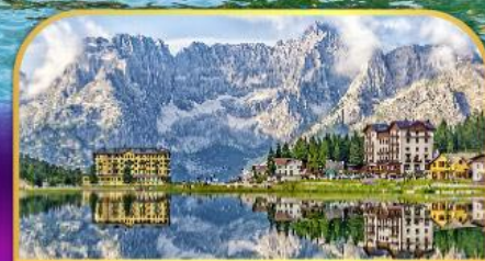
ทะเลสาบมิสุรีนา