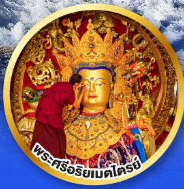
พระศรีอริยเมตไตรย์