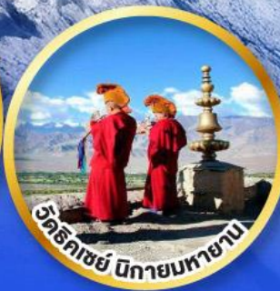
วัดริคเซย์ ปิกายมทายาน