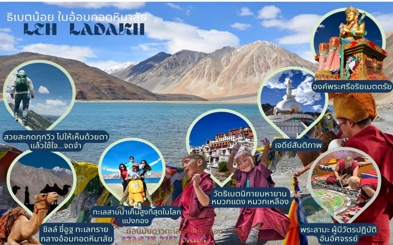
องค์พระศรีอริยเมตตรีย์