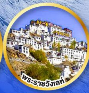
พระราชวังเลห์