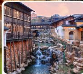
เมืองโบราณเหยาหู