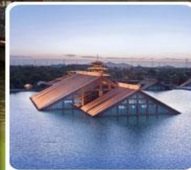
พิพิธภัณฑ์ไต้บ้ำกวงฟู่หลิน