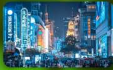
ถนนนานกิง