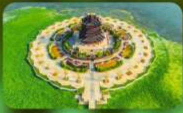
วัดฉงหยวน