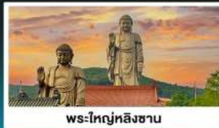
พระใหญ่หลิงซาน