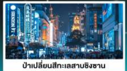
ป่าเปลี่ยนสีทะเลสาบชิงชาน