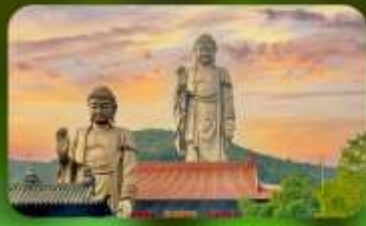
พระใหญ่หลิงซาน