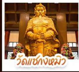
วัดเชกงไฉมว