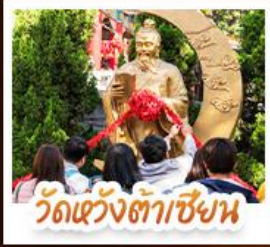
วัดเซ่งต้าซิงน