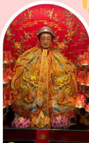
วัดหล่งโหมว

ความสำเร็จ ความมั่งคั่ง เงินทองไหลมาเทมา