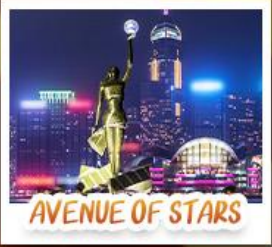
AVENUE OF STARS