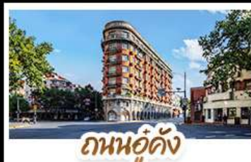
ถนนอยู่ดัง