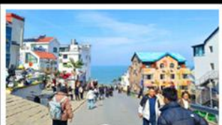
ถนนคอปเปลิ่งตามาหมายเลข 8

สัมผัสความยิ่งใหญ่ของ 4 เมืองสำคัญ ชิงเต่า - เยียนโก - เฟิงไห่ - เว่ยไห่ ปาต้ากวน - โบสถ์คาทอลิก - ตึกเก่าริมหา