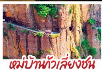
หมู่บ้านกัวลิ่งซุน