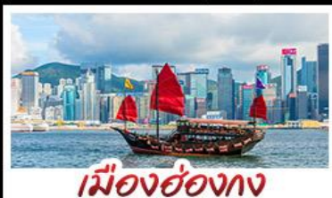
เมืองฮ่อทง

เมืองเก่าชิงเต่า - วิวเมืองฮ่อทง โรงเบียร์ชิงเต่า - ท่าเรือชาวประมงเยียนไก