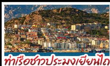
ท่าเรือชาวประมงเยียนไก