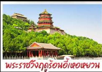
พระราชวังฤดูร้อนอ้าเฮอเฉาหวาน

มือพิศข เปิดปิกกั๊ง สุกั๊มอ๊งโท MICHELIN GUIDE ร้าน TAO TAO JU