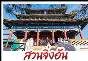
สวนจิ้งอัน