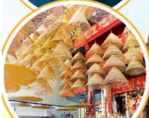
ไหว้พระวัดดัง