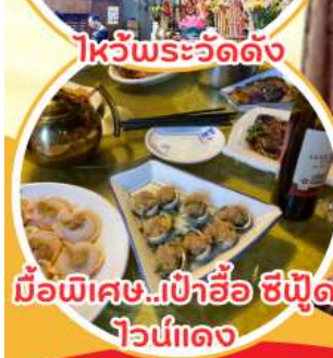
มือพิเศษ...เป่าอ้อ ซิฟู๊ด ไวน์แดง