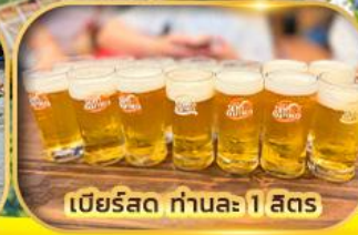
เบียร์สด ท่านละ 1 ลิตร