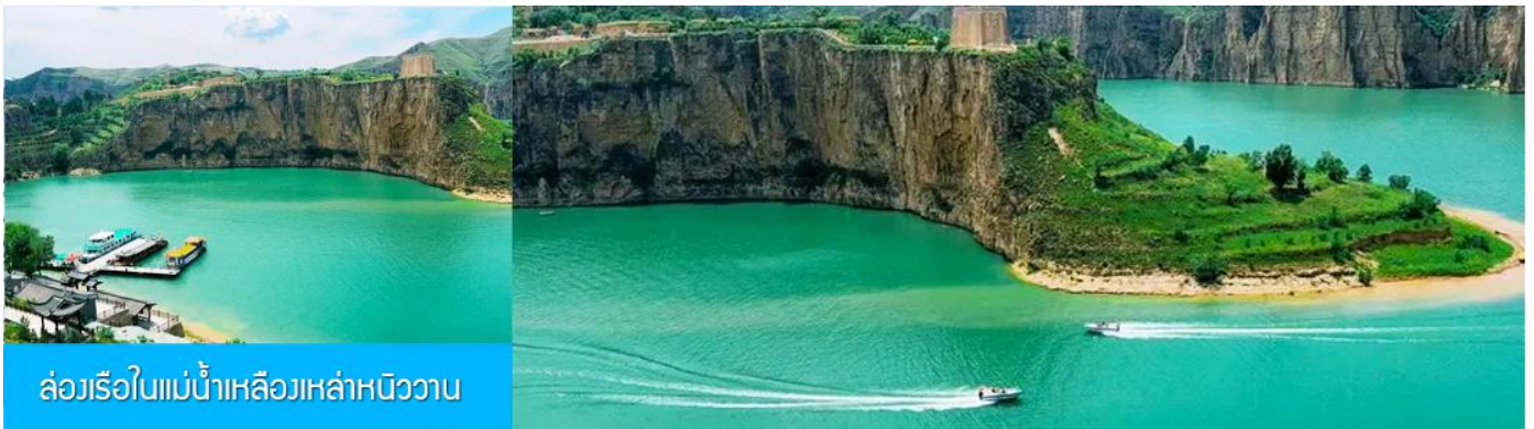
ล่องเรือในแม่น้ำเหลืองเหล่าหนิววาน

เที่ยง รับประทานอาหารกลางวัน ณ ร้านอาหารระหว่างทาง (8)