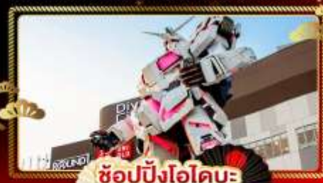
ช้อปปิ้งโอไดบะ