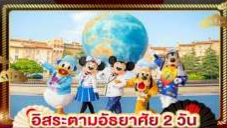
อิสระตามอริยาศัย 2 วัน