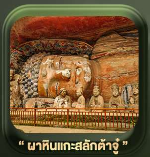
“ พาทินแกะสลักต้าจู้ ”

วันเดินทาง มี.ค. - ต.ค. 2569 ราคาเริ่มต้น 22,999.-