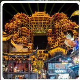
ตึกหอคอย 72