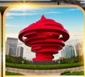
จตุรัสห้าสี