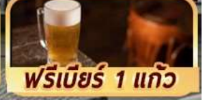
ฟรีเบียร์ 1 แก้ว