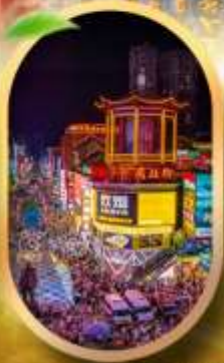
ถนนคนเดินซิงสุ่