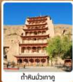
ถ้ำหินมั่วเกาตุ

• ไฮไลท์...เส้นทางสายไหม ชมสระน้ำวังพระจันทร์ ทะเลทรายหมิงซาซาน กำแพงเมืองจีนด่านสุดท้าย "เจี๋ยวิ่กวน" มรดกโลกภูเขาสายรุ้งจางเย่