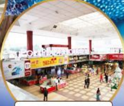
ตลาดกังเป๋