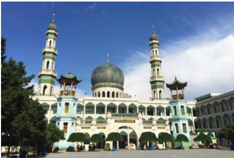
มัสยิดเมืองตงกวน