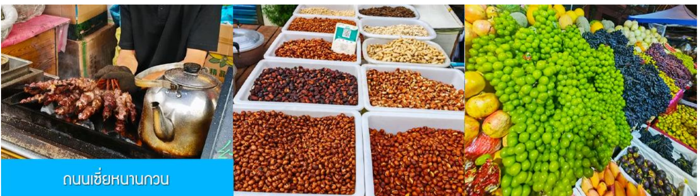
ถนนเซี่ยหนานกวน

เที่ยง รับประทานอาหารกลางวัน ณ ภัตตาคาร (16) หลังอาหารนำท่านเดินทางโดยรถบัสสู่ เมืองซีหนิง 西宁 (ระยะทาง 289 กม. ใช้เวลาเดินทางราว 3 ชั่วโมงเศษ)