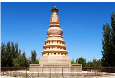
เจดีย์ม้าขาว

เที่ยง รับประทานอาหารกลางวัน ณ ภัตตาคาร (10)