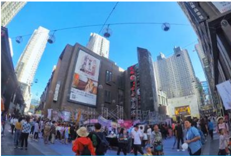
ย่านการค้าและถนนคนเดินลี่เหมิง