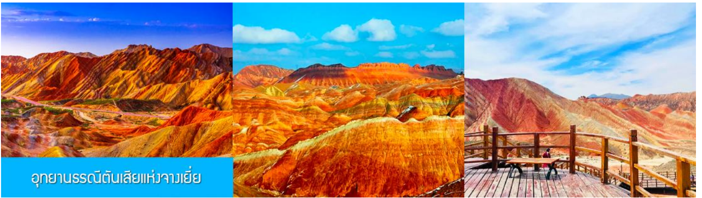
อุทยานธรณีดินสีแห่งจางเยี่ย