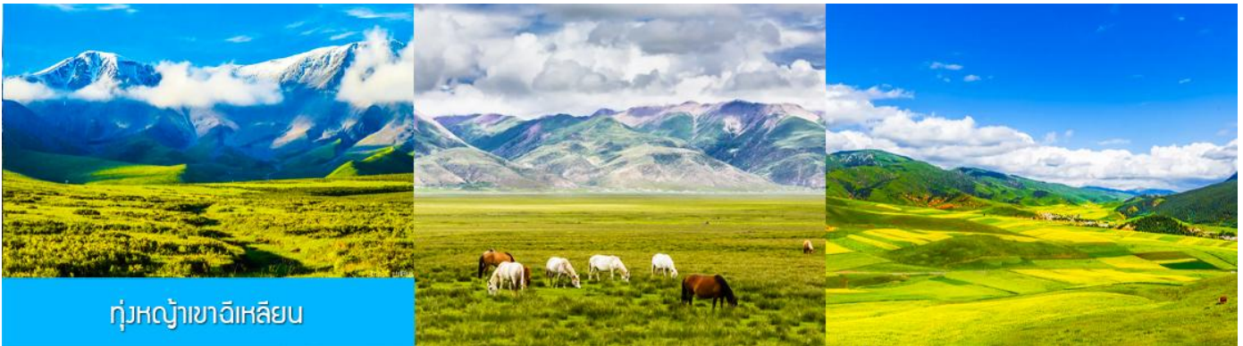
ทุ่งหญ้าฉีเหลียน

จากนั้นนำท่านเดินทางโดยรถบัสสู่ทุ่งหญ้าฉีเหลียน (ระยะทาง 140 กม. ใช้เวลาเดินทางประมาณ 2 ชั่วโมง)