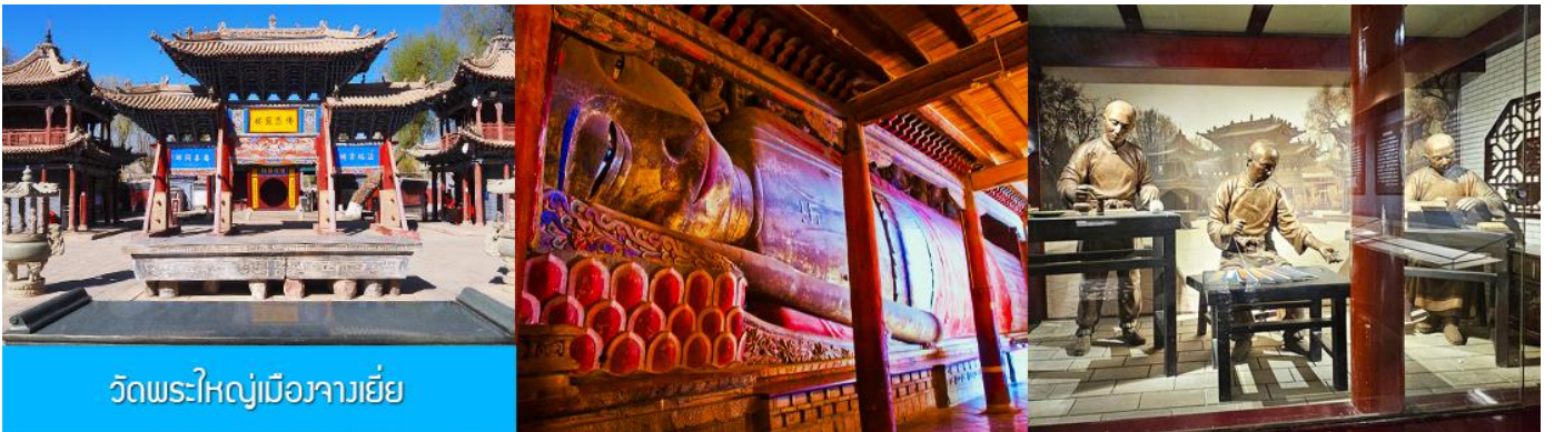
วัดพระใหญ่เมืองจางเยี่ย

รับประทานอาหารเช้า ณ ห้องอาหารของโรงแรม (15)