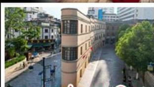
ถนนเก่าคุณหมิง