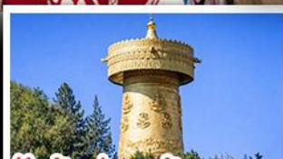
วัดต้าฝอ กงล้อมณฑล