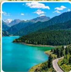
อุทยานเทียนชาน เทียนฉือ