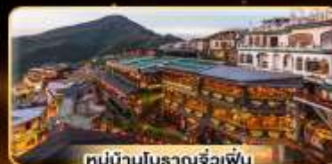
หมู่บ้านโบราณช้่วเฟิ่น