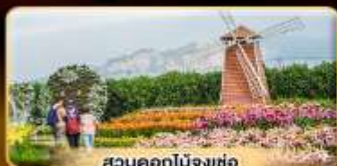
สวนดอกไม้งาช่อ