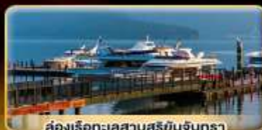
ส้องเรือทะเลสาบสุริยน้จันทรา