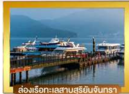
ส่องเรือทะเลสาบสุริยันจันทรา