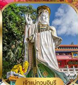
เจ้าแม่กวนอิม พลัสเบย์