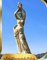
จูไห่ฟิชชอร์ทิวรา