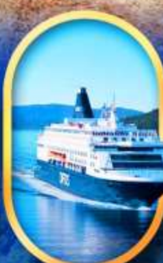
นั้งเรือ DFDS