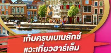
เก็บครบเบนลักซ์ แวะเที่ยวฮาร์เล็ม