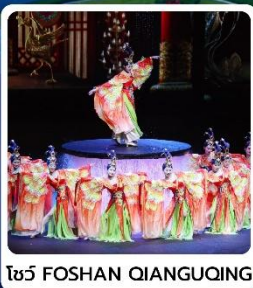
โชว์ FOSHAN QIANGUING