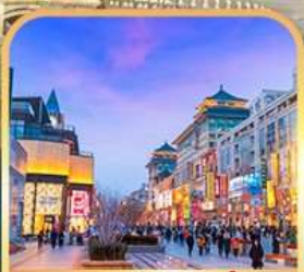
ถนนหวงฟู่จิ่ง