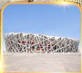
สนามกีฬารังนก