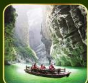
ล่องเรือแม่น้ำไตคินกูฮิว