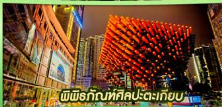
พิพิธภัณฑ์ศิลปะตะเกียบ