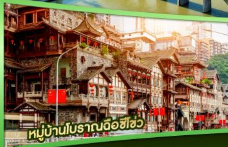
หมู่บ้านโบราณฉือฮิว