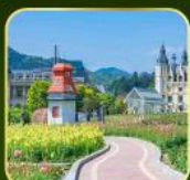
สวน Alice's Garden