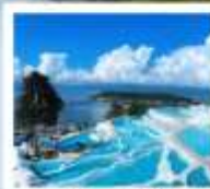
ซานโตรินี่ด้าหลี่

“เกาะเสี่ยวผู...เกาะลึกลับกลางทะเลสาบ เอ้อไห้”