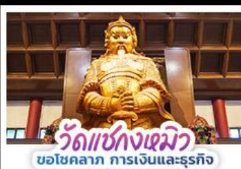
วัดแห่งกวงเมียว ขอโชคลาภ การเงินและธุรกิจ