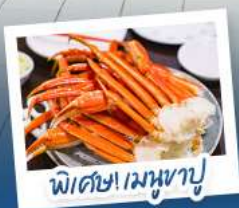
พิเศษ! เมฆหามู