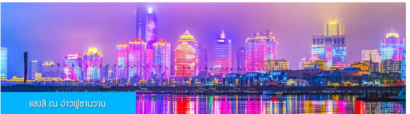
แอสสิ ณ อ่าวฟู่ซานวาว

ค่ำ รับประทานอาหารค่ำ ณ ภัตตาคาร *เมนูซีฟู้ด (3)