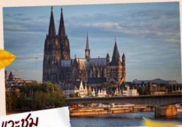
แวะชม มหาวิหารโคโลญ