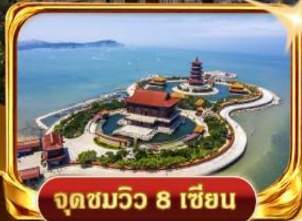
จุดชมวิวกว 8 เชียง