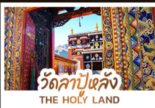
วัดลาปูหลง THE HOLY LAND

หนึ่งศรัทธา: สัมผัสความสงบและสถาปัตยกรรมทิเบตที่ วัดลาปูหลง หนึ่งผืนหญ้า: ส่องลอยไปในความเขียวจีของทุ่งหญ้าชางเคอ หนึ่งสายน้ำ: ค้นพบความงามเหนือกาลเวลาที่ จิวจ้ายโกว