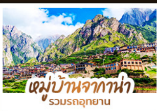
หมู่บ้านจากาน่า รวมรถอุทยาน