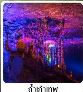
ดำเก้าทพ