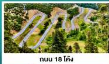
ถนน 18 โค้ง