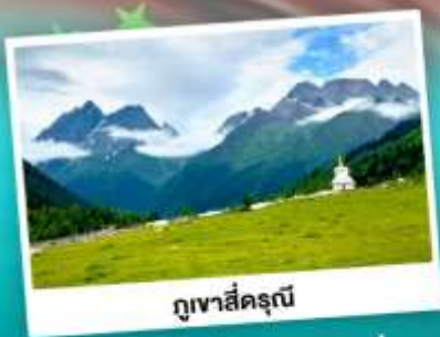
ภูเขาสีครุณี

ชมความสวยงามทุ่งหญ้าด่าง เทือกภูเขาสีครุณี อุทยานยาดิง "แซงกรีคว่าแห่งสุดท้าย" S-ดบ 5A