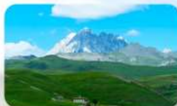
ทุ่งหญ้าด่าง