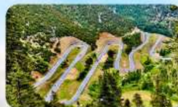
ถนน 18 โค้ง