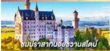
ชมปราสาทนอยชวานสไตน์