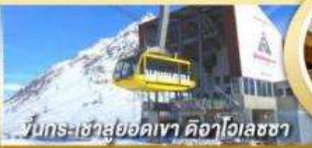
ขึ้นกระเช้าสู่ยอดเขา คีอาไวลชช