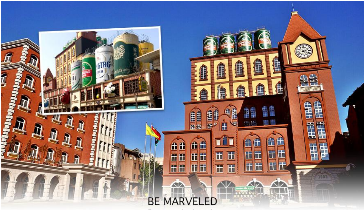
BE MARVELED โรงงานเบียร์สิงห์