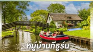
หมู่บ้านทีรูร์น