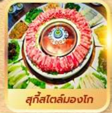
สุกีสโตล์มองโก