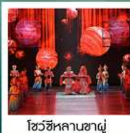
โชว์ซีหลานซาผู้