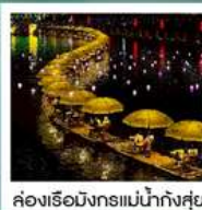
ห้องเรือมังกรแม่น้ำก้งซู่