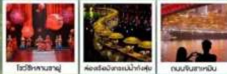
โชนซึหาคานซาญู