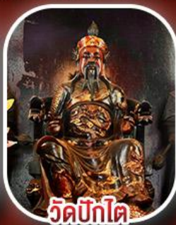
วัดปึกไต่