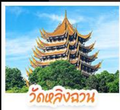
วัดเลิ่งฉวน