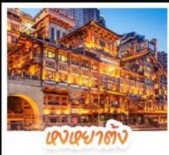
แสงเซาตัง

สัมผัสใบไม้แดงสุดงดงามที่ ภูเขาหมื่นชางซาน และ ภูเขากวงอู๋ซาน ชมวิวกลางคืนสุดอลังการที่ หงหยาดัง แลนด์มาร์กชื่อดังแห่งฉางชิ่ง สักการะพระโพธิสัตว์เจ้าแม่กวนอิม ณ วัดหลิงฉวน ขอพรเสริมสิริมงคล เช็กอินแลนด์มาร์กสุดฮิต แพนด้าปิ่นตึก IFS + POP MART ช้อปปิ้งจุใจที่ ไถ่กุหลี่ ถนนคนเดินซุนซู่