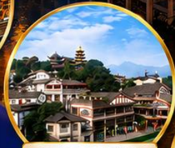
เมืองโบราณเฉิงชิว