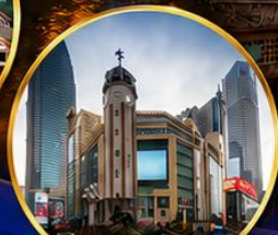
ถนนคนเดินเจียฟางเป่ย์