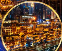
หงหยาดิ่ง