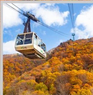
“ZAO CHUO ROPEWAY”