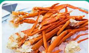
พิเศษ! บุฟเฟ่ต์ขาปู